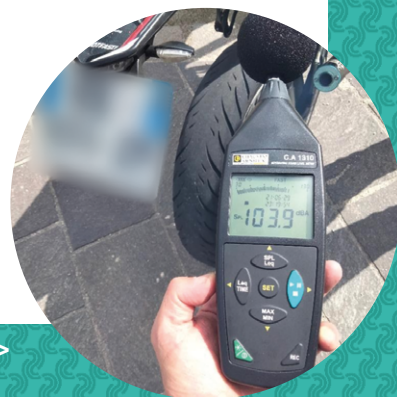
Le sonomètre >

pour la destruction de nids de frelons asiatiques, dont 8 pour des particuliers et 4 à la charge de la commune.