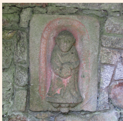
Statue de Saint-Mamert

Roland : la chapelle est ouverte à chaque festivité religieuse, et de juin à septembre. À Noël, une crèche est installée et nous pouvons retrouver l'exposition de miniatures de chapelles et de monuments entièrement réalisée par mon frère.